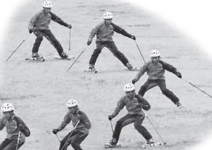
3~4にかけて、外脚の上に重心を移動しながら足もとをフラットにする動きがみられる。これによって、結果的に次のターン前半で内脚主導の操作につなげることが可能となる

角付けの角度が一定のままターンを仕上げてしまったり、切り換え直前まで角付けが強まっていくような操作ではなく、ターン後半で外脚の上に重心を移動しながらスキーをフラットに近づけるエクササイズです。切り換えのための適切な重心位置と移動方向が理解できると、効率良い連続ターンを行うことができます。また、最後までしっかりと外脚をターン終了方向へ動かすことで、流れのある切り換え操作を表現できるはずです。外脚主導とは言っても、山回りの最後まで外スキーを踏み続ける動きとは異なることに注意しましょう。