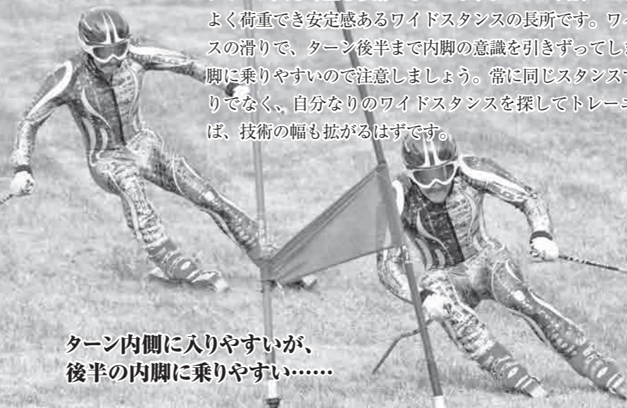
ターン内側に入りやすいが、後半の内脚に乗りやすい……

ポールの直前(ターン前半)では、ワイドスタンスによりフォールラインに大きく重心移動できています。これは両脚の上にバランスよく荷重でき安定感あるワイドスタンスの長所です。ワイドスタンスの滑りで、ターン後半まで内脚の意識を引きずってしまうと、内脚に乗りやすいので注意しましょう。常に同じスタンスで滑るばかりでなく、自分なりのワイドスタンスを探してトレーニングすれば、技術の幅も広がるはずです。