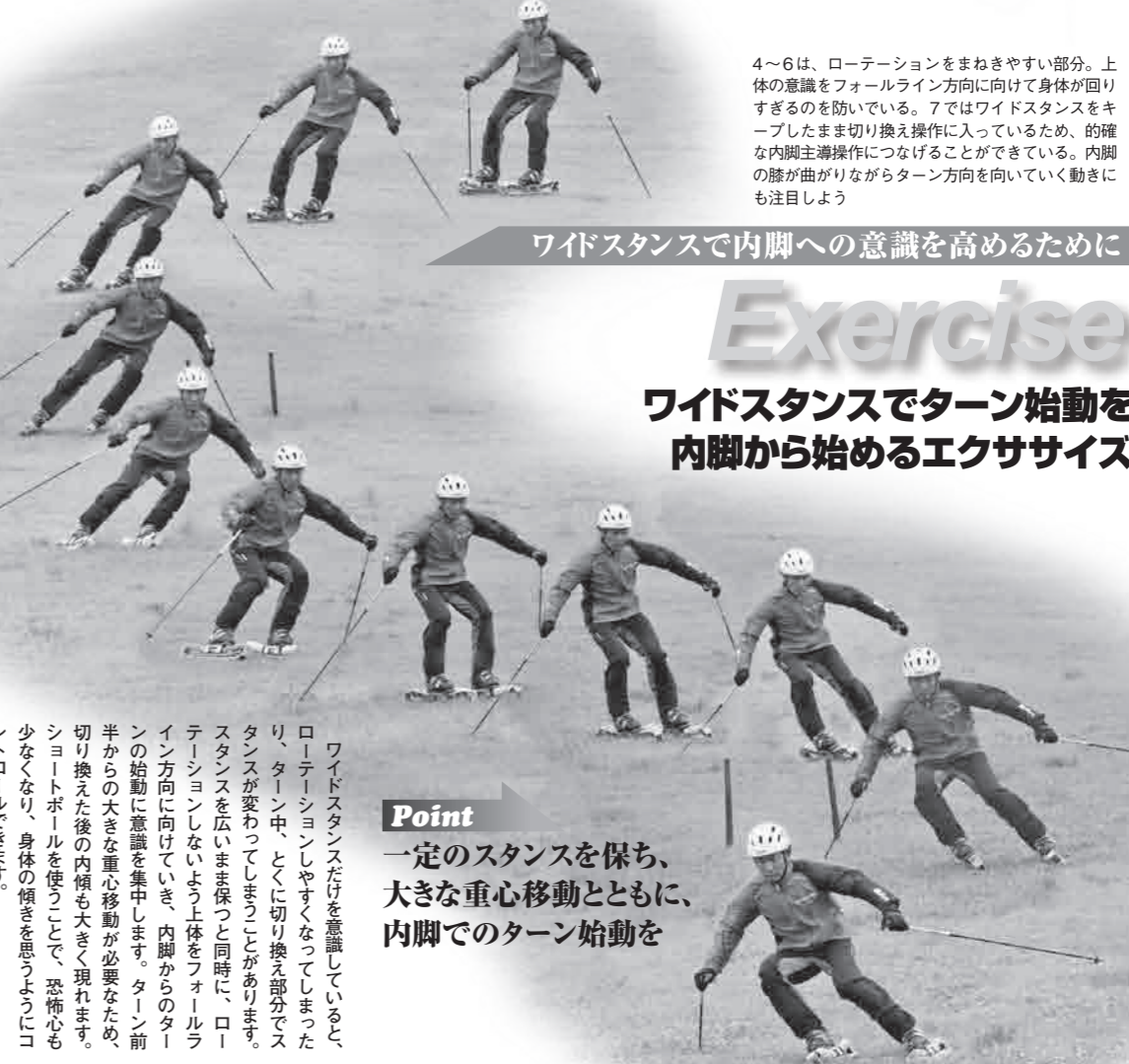
ワイドスタンスで内脚への意識を高めるために

4~6は、ローテーションをまねきやすい部分。上体の意識をフォールライン方向に向けて身体が回りすぎるのを防いでいる。7ではワイドスタンスをキープしたまま切り換え操作に入っているため、的確な内脚主導操作につなげることができている。内脚の膝が曲がりながらターン方向を向いていく動きにも注目しよう