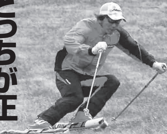
ターン後半に有効だが、前半では内側に入りにくい...

ターン後半のベースは、外脚荷重ですが、しっかりと外脚荷重しているつもりでも、実際の重心は内脚の上であり外脚に「乗りきれていない」ことも多いものです。外脚をターン終了方向へ動かし続け、それをターン運動に結びつけるためには、確実に外脚の上に重心をキープすることが大切です。ただし、ターン前半から外脚への意識が強すぎる場合は、結果的に重心移動に時間がかかるため、明確な切り換えが行えず、十分な内傾角もとれません。したがって外脚主導の操作はターン後半に集中して現われるのが理想と言えます。